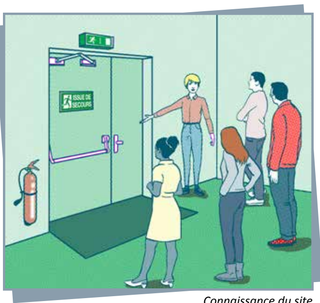
Connaissance du site

Il est conseillé d'organiser un exercice annuel intrusion/attentat en s'inspirant des consignes ou instructions du ministère de l'éducation nationale. A cet effet, un fascicule, destiné en priorité aux mineurs les plus jeunes est joint en annexe au présent guide.