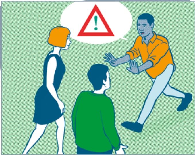
Alertez les personnes autour de vous

► Adapter votre réaction à la situation :